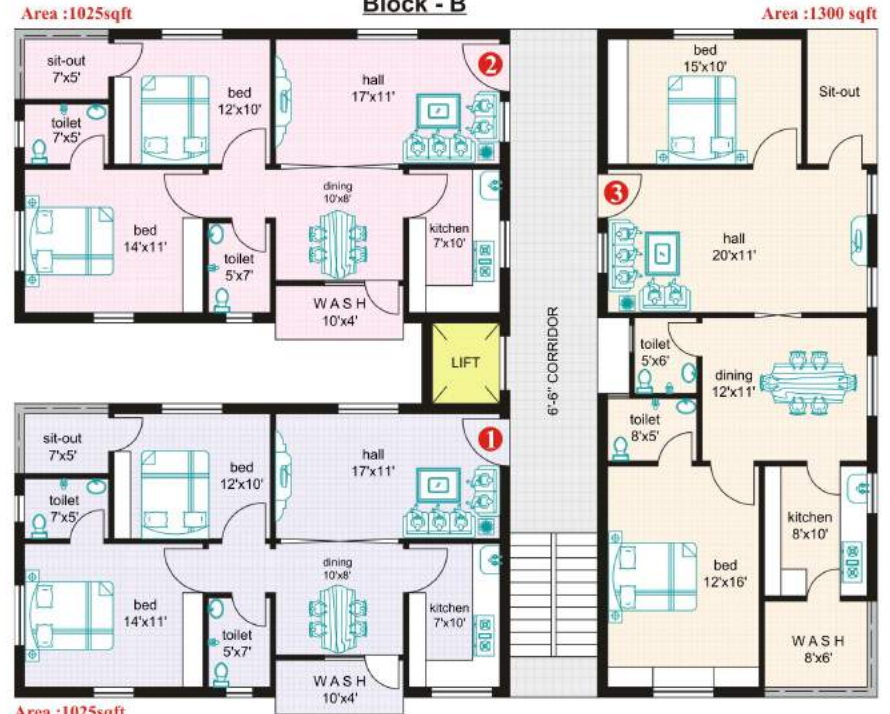
Block - B