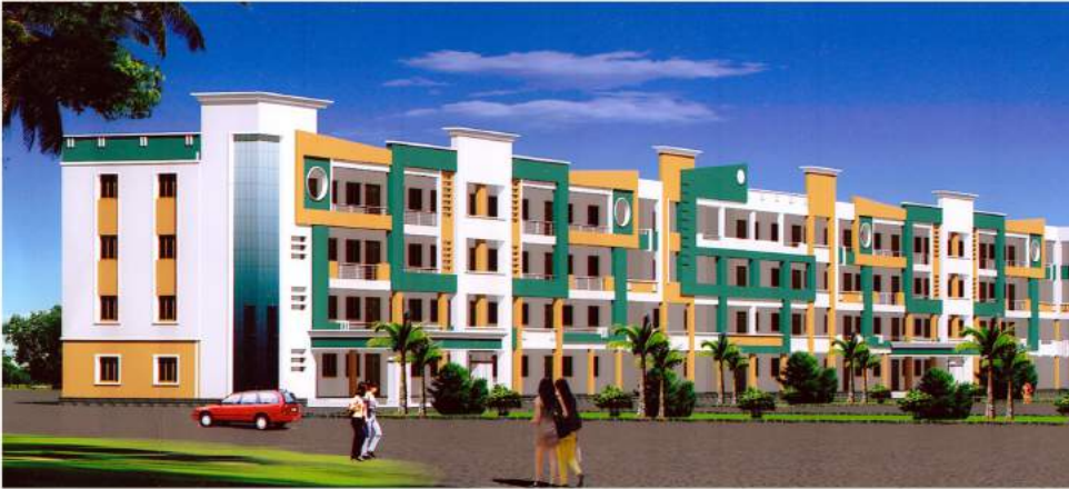
KALLAM HARANADHA REDDY INSTITUTE OF TECHNOLOGY GUNTUR.